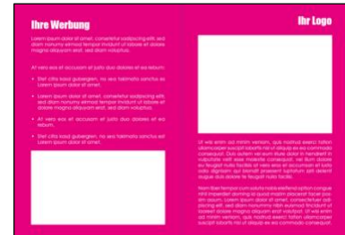
Beispiel Werbeanzeige vor jedem Kalendermonat