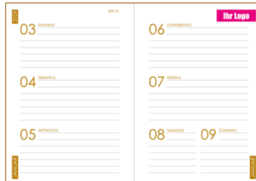
Beispiel Logo auf der Seite «Wochenübersicht»