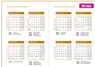
Beispiel Logo auf der Seite «Monatsübersicht»